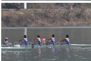
男子舵手付クォドルプル優勝