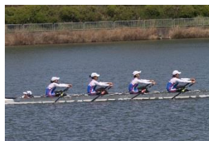
高校女子舵手付クォドルプル優勝