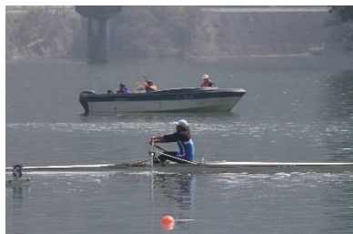
女子シングルスル優勝

【全国高校選抜ボート大会 天竜ボートコース 3月18～20日】 史上初 3 種目全国制覇!