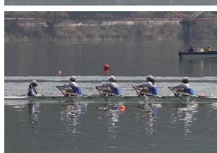
女子舵手付クォドルプル 4 位