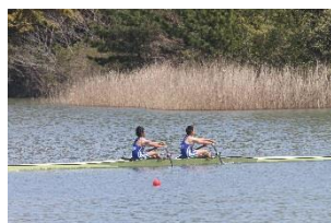
高校男子ダブルスカル優勝