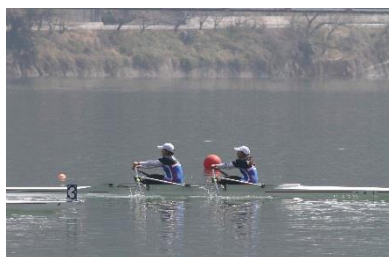
女子ダブルスル優勝