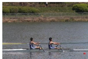
高校男子ダブルスカル 2 位