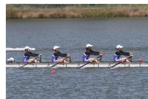
高校女子舵手付クォドルプル 2 位